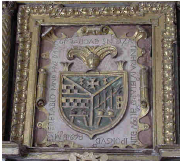
Blasón que corona el retablo, existente en la Iglesia de Santa M a la Real de Cesuris (Manzaneda)